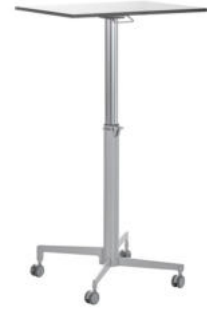
MESA REGULABLE ALTA PROFESOR REF. 1.6598

Se suministra premontado. Regulable de 76 cm a 120 cm. Tablero de 70 cm x 50 cm. Mesa de columna central color gris, con pistón de ayuda para regular la altura de 76 cm a 120 cm.