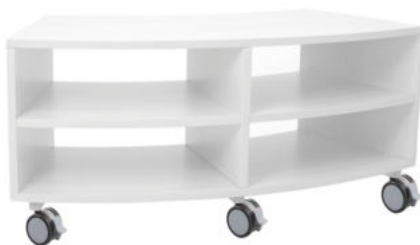
MUEBLE BASE CURVO PEQUEÑO CON RUEDAS REF. 1.9761