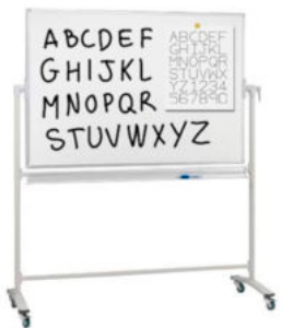
PIZARRA DOBLE CARA BASIC REF. 1.8457

Se suministra desmontado. Pizarra móvil imantada. Giratoria de doble cara con giro horizontal de 360°. Con bandeja repisa y 4 ruedas, 2 de ellas con freno. Tablero 150 cm x 90 cm. Alto 180 cm.