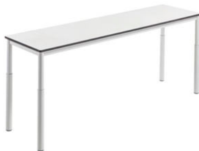
MESA RECTANGULAR MENORCA REF. 1.8805