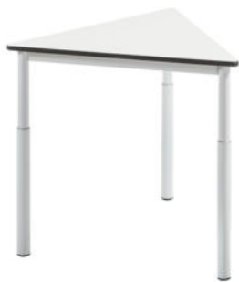
MESA TRIANGULAR MENORCA REF. 1.8861