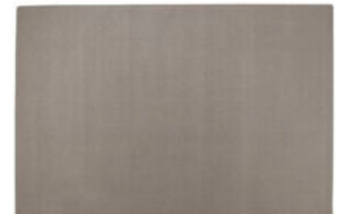
ALFOMBRA RECTANGULAR REF. 51276

Largo 300 cm, ancho 200 cm. De POLIAMIDA 2100 g/m 2 cosido con el dorso de tejido sintético y fuerte. - Gr: 0,6 cm. Uso especial y lavados intensivos. Anti-bolas