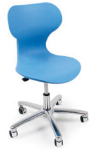
SILLA REGULABLE EN ALTURA EASY REF. 1.4868

Se suministra premontado. Silla monocarcasa de polipropileno de color de dimensiones 48 cm x 28 cm x 40 cm. Sobre una base de 5 ruedas cromadas y pistón de gas para regular la altura del asiento.