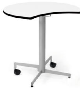
PUPITRE ABATIBLE HPREMIUM MEDIA LUNA REF. 1.7654

Se suministra premontado. Fabricado con estructura de acero. Pies en forma de cruz a diferente altura para una fácil recogida. 2 ruedas y dos pies fijos. Ø 69,3 cm. Altura 76 cm.