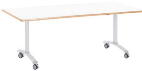
MESA ABATIBLE WHITE REF. 1.5382

Se suministra desmontado. Montada sobre una estructura de acero. Abatible en su eje central. Superficie de tablero estratificada de 19 mm. Dimensiones: 160 cm x 80 cm. Altura 76 cm.