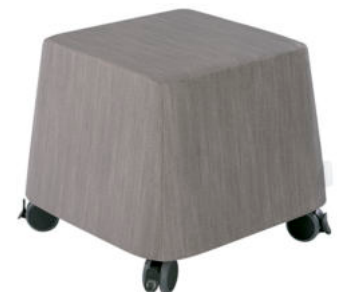
PUF CON RUEDAS REF. 58527

Tela revestida. Interior de espuma alta densidad, 24 kg/m 3 . No se hunde con el tiempo. Lavado con agua o nuestro producto limpiador. Dimensiones: Largo 50 cm x ancho 50 cm. Altura 43,5 cm.