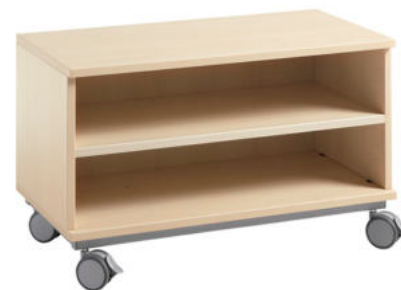
MUEBLE COMBI PEQUEÑO CON RUEDAS SIN PUERTAS REF. 1.9998