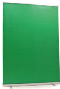
PANTALLA CHROMA PLEGABLE REF. 3.0225

Pantalla chroma plegable con sistema rollup, de fácil montaje y desmontaje. Una vez plagado ocupa muy poco espacio. Lona Ecoflat 398g/m 2 . Dimensiones abierto: Alto 200 cm x ancho 150cm.