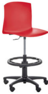
SILLA REGULABLE NORDIC REF. 1.6826

Se suministra premontado. Asiento y respaldo de polipropileno. Regulable en altura mediante cilindro. Altura mínima 55 cm y máxima 75 cm. Aro reposapiés. Tiene 5 ruedas.