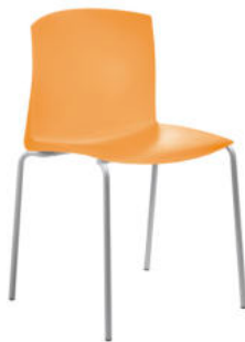
SILLA NORDIC FIJA 4 PIES REF. 1.2610