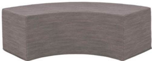
PUF CURVO REF. 63521

Ideal para aulas colaborativas. Complemento perfecto para el mueble curvo. Permite crear una zona de reunión, lectura o distendida en el aula. Interior de espuma de 24 Kg/m 3 de densidad. Revestida de tela PVC, con aspecto tejido. Equipado con una base antideslizante.