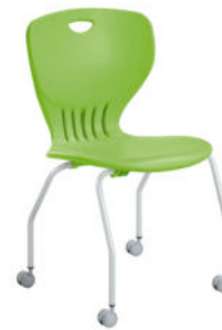
SILLA ESCOLAR ANTA CON RUEDAS REF. 1.9997