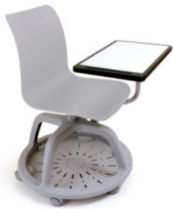
SILLA PUPITRE DUO REF. 1.5450