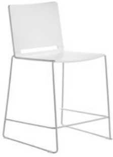
SILLA ALTA YORK ALTURA 730 REF. 1.6585

Se suministra montado. Estructura de trapecio de acero pintada aluminio. Asiento de polipropileno. Apilable hasta 15 unidades. Altura 73 cm.