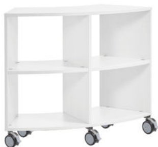
MUEBLE BASE CURVO MEDIANO CON RUEDAS REF. 1.9760