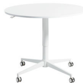
MESA REGULABLE MOOVE2 REF. 1.6958