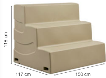
GRADA OLA RECTA REF. 1.6928

Se suministra montado. Ideal para el trabajo colaborativo. Espacio de aprendizaje fuera del aula o de reuniones de alumnos. Fabricada en rotomodelo de un solo bloque con polipropileno de color. Apta para interior y exterior. Colores resistentes a rayos UV sin mantenimiento. Escalones de 39 cm x 39 cm. Soporta 630 kg. Dimensiones grada Ola recta: Ancho 150 cm x profundidad 117 cm. Altura 118 cm. Dimensiones grada Ola curva: Ancho 50 cm x profundidad 117 cm. Altura 118 cm.