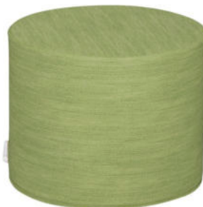
PUF REDONDO NEW BASIC REF. 56462

Revestido con tela PVC impermeable aspecto tejido de gran calidad. Interior de espuma alta densidad, 24 kg/m 3 , ignífuga M2, higiénica y resistente. No se hunde con el tiempo. Dimensiones: Diámetro 50 cm. Altura 40 cm.