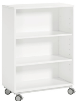
CON RUEDAS Altura 110 cm