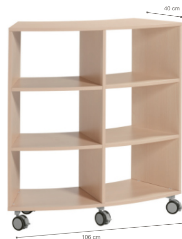
ARMARIO ALTO CURVO CON RUEDAS

Realizado con paneles de melamina, acabado en color blanco con cantos de PVC de 2 mm. Provisto de 2 estantes en su interior regulables en altura. Zócalo metálico con 4 ruedas con freno. Dividido verticalmente en 2 partes. Dos estantes fijos en altura por cada lado. Dimensiones: ancho 80 cm x profund. 40 cm.