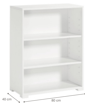
CON PIES Altura 103 cm