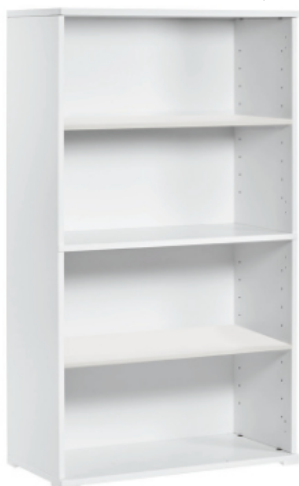
CON PIES Altura 140 cm