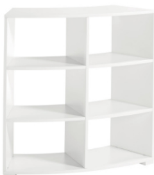
CON PIES Altura 103 cm