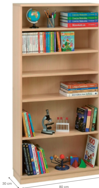
LIBRERÍA BIBLIOTECA CON ZÓCALO