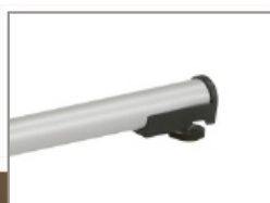
Pata con nivelador