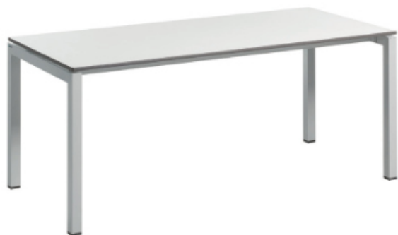
MESA COMEDOR ATLANTIS 180 X 80 CM