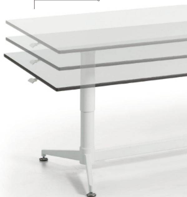
MESA COMEDOR REGULABLE MOOVE2 RECTANGULAR 180 X 80 CM

Mesa rectangular 180x80 cm regulable en altura de 59 a 76 cm. Base de dos columnas redondas con 2 travesaños de sujeción con pies y columna central que une el tablero de CDF blanco de 16 mm de grosor resistente al agua. Se acciona mediante palanca en el lateral de la mesa. Sistema de elevación mediante pistón de gas. Dimensiones: 180 x 80 x 59/76 cm.